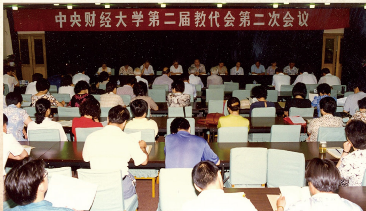
第二届教代会第二次会议