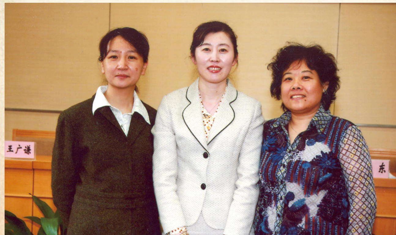
第六届经审委员会委员