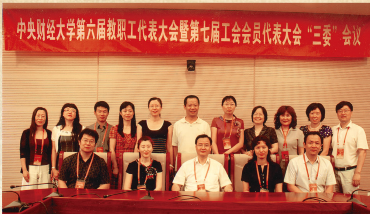
第七届工会委员会委员