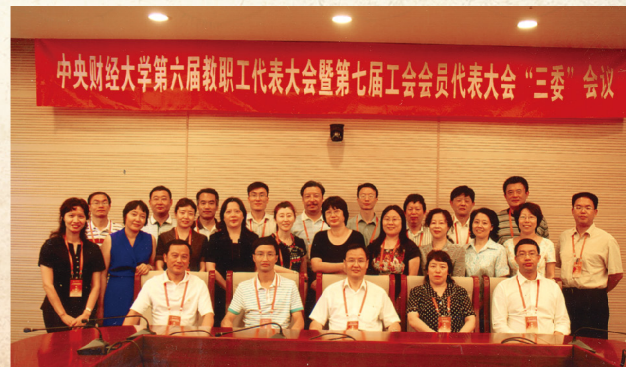
第六届教代会执委会委员