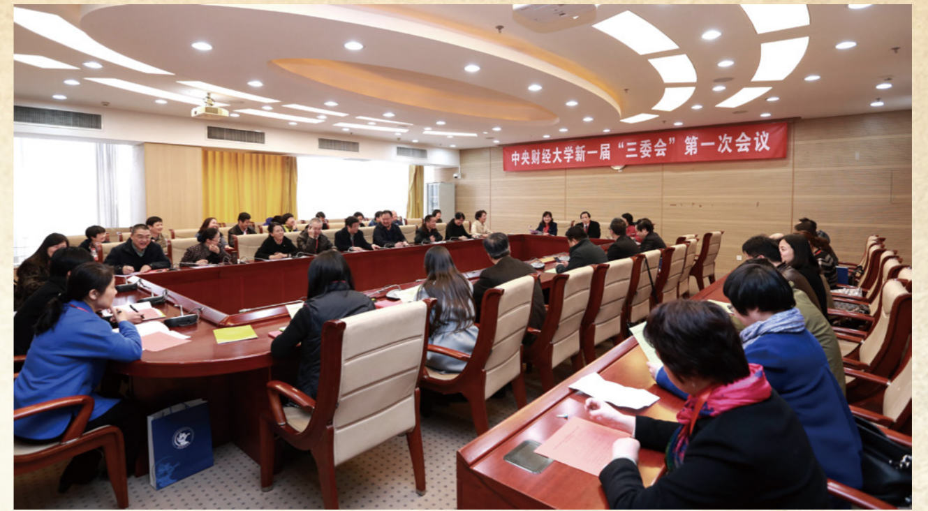
三委会第一次会议