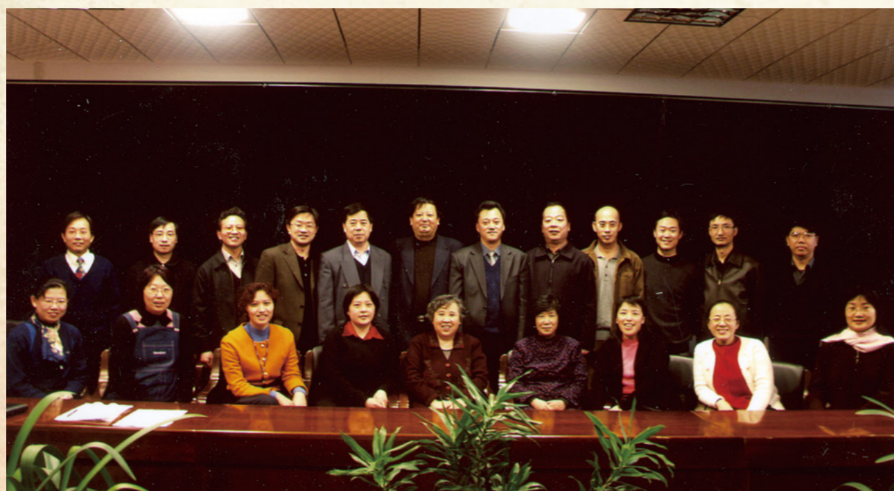
第四届教代会执委会委员