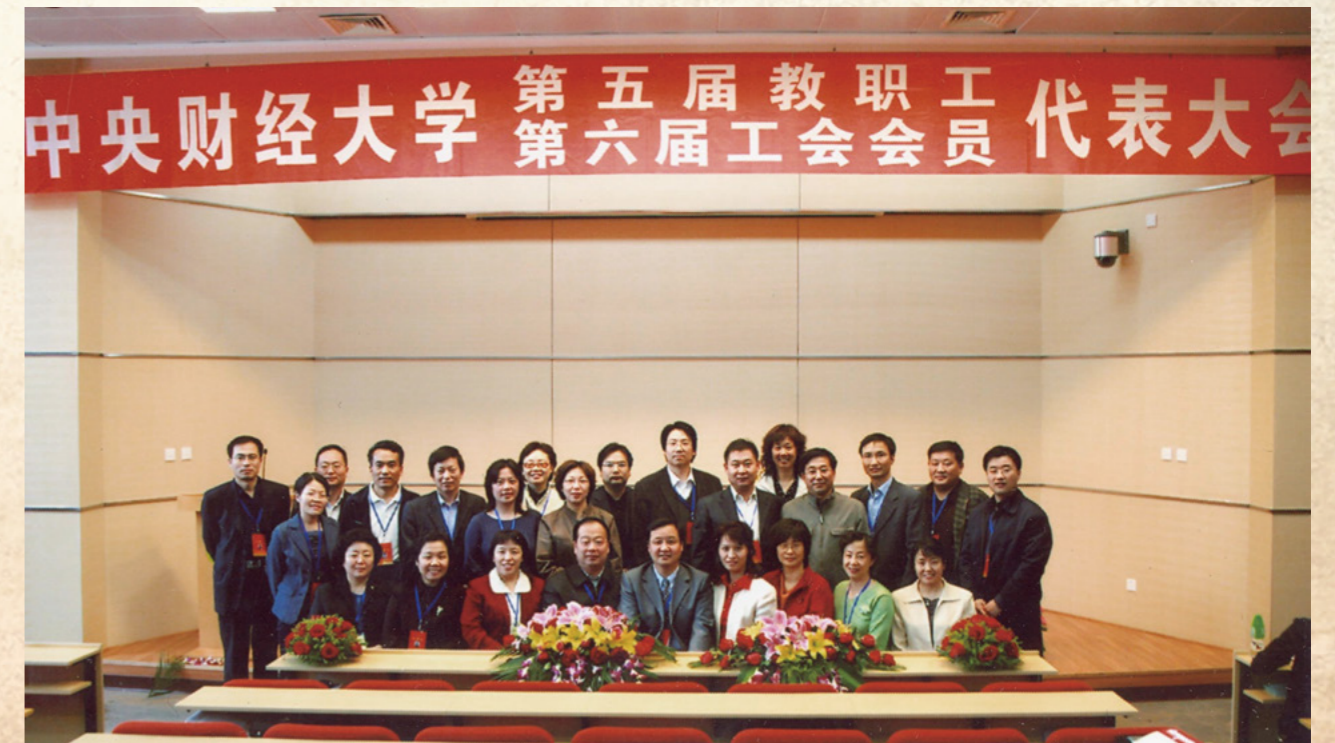
第五届教代会执委会委员