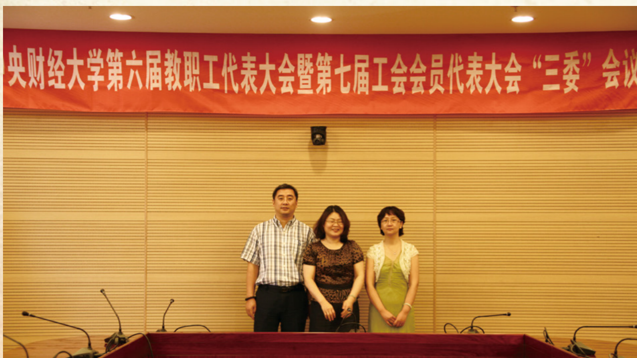
第七届经审委员会委员