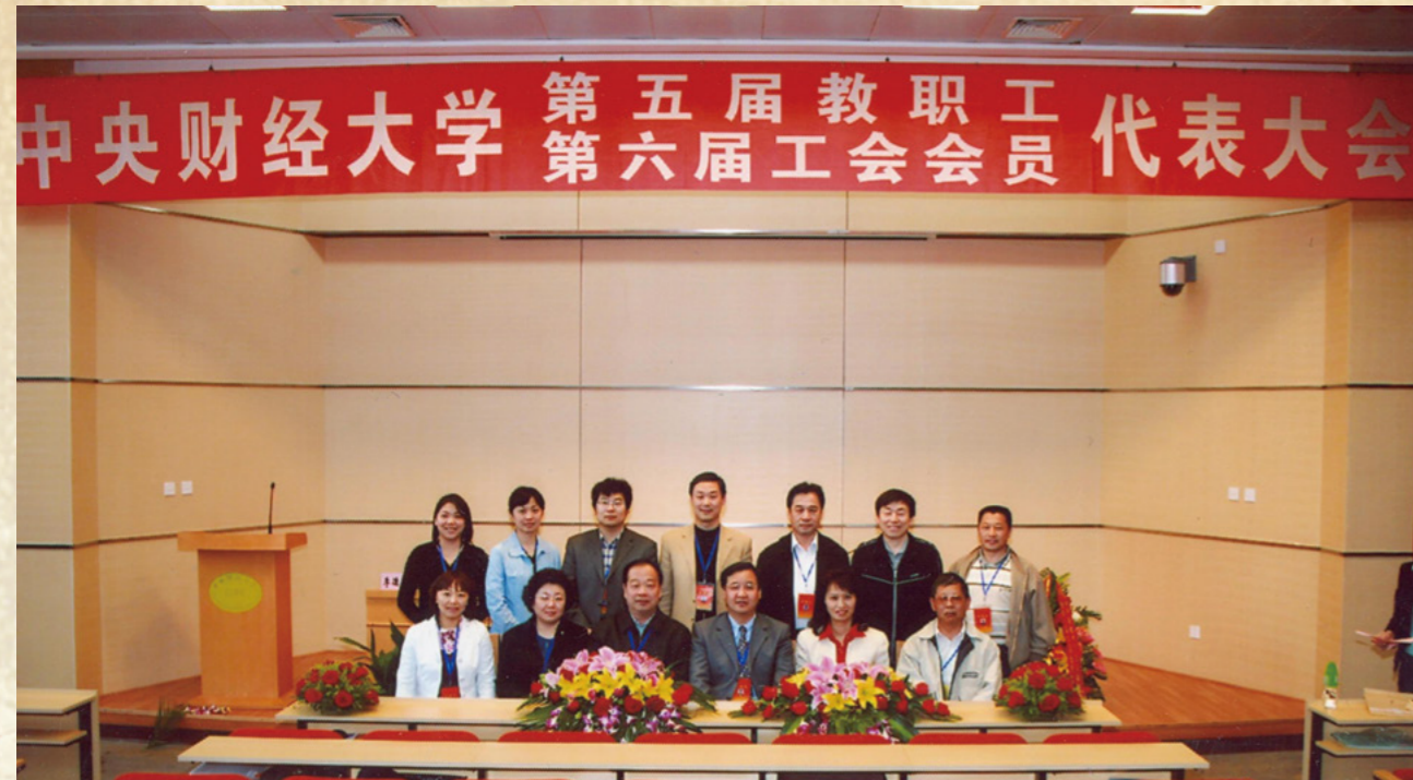
第六届工会委员会委员