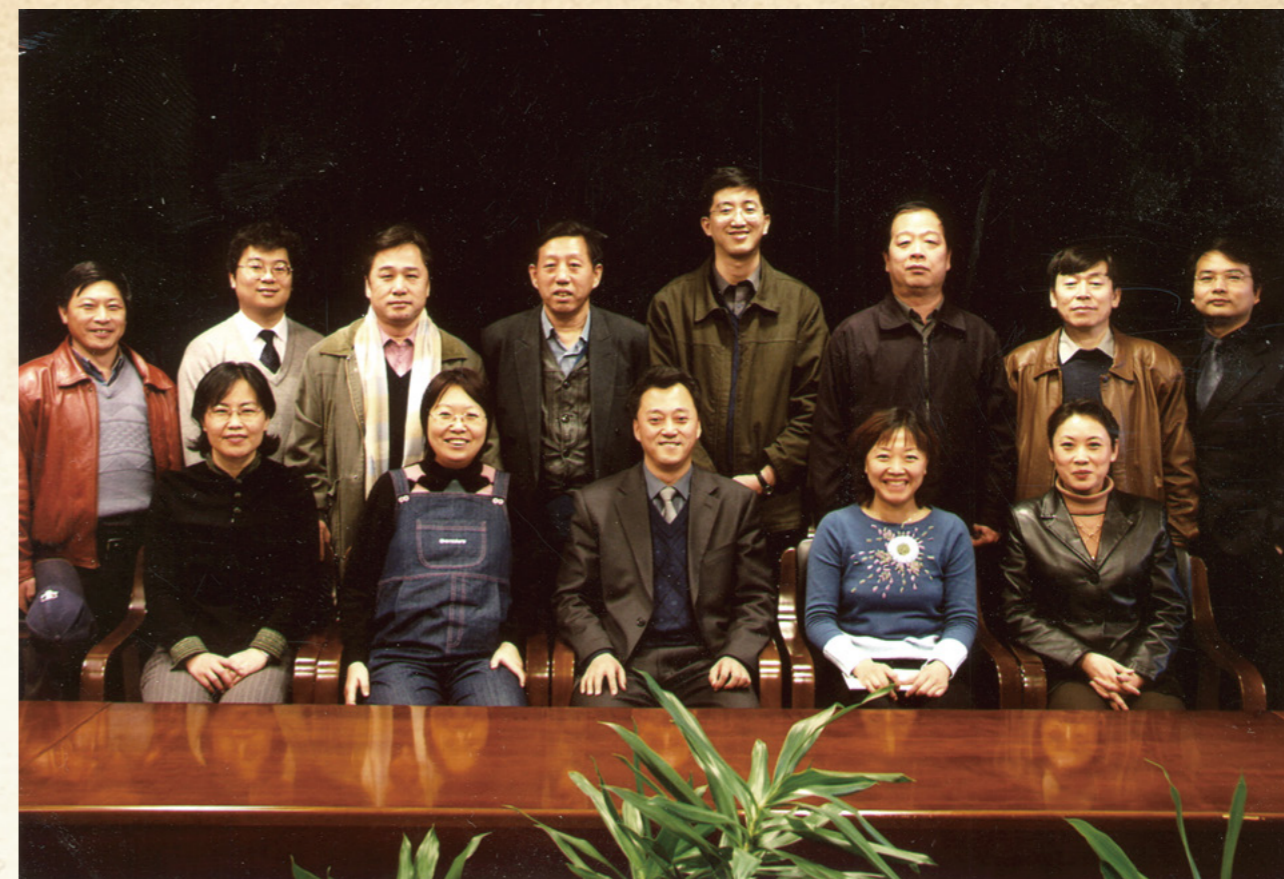
第五届工会委员会委员